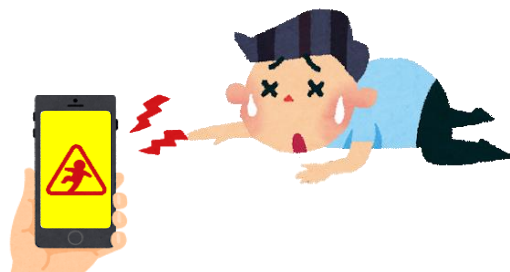
高齢者への転倒検知システムの導入