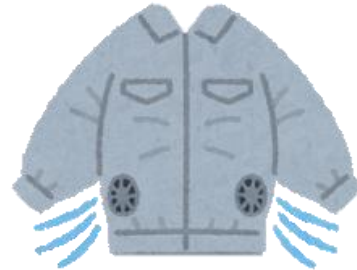
全作業員への最新型空調服の支給