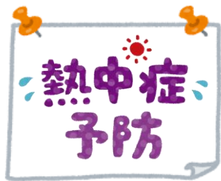
掲示による意識付けの強化

作業員の安全と健康を守るため、熱中症対策をより一層強化しました。現場の実態に即したさまざまな対策を講じることで、安心して働ける環境づくりを進めています。