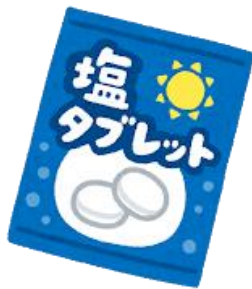
全作業員へ塩分補給タブレットの支給